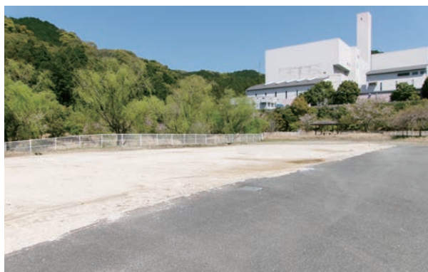
リサイクル工房棟跡地

また、次期ごみ処理施設の建設計画に伴って、令和7年10月から実施中の生活環境影響調査は、今年9月末までの予定となっています。周辺地域住民の皆様におかれましては、引き続き、調査へのご理解とご協力をよろしくお願いいたします。