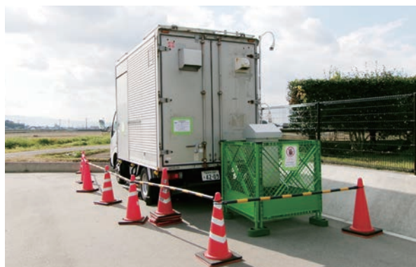
大気質調査の観測車