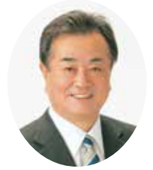
令和5年 年頭のごあいさつ