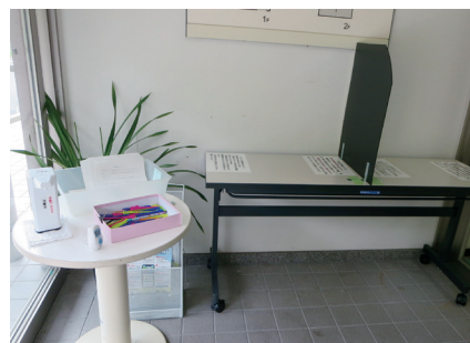
検温・シート記入