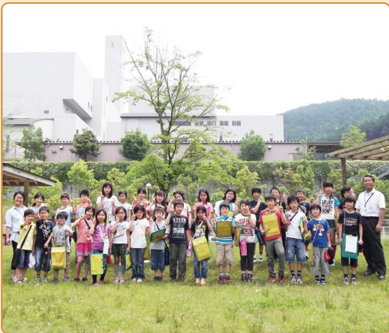
久留米市北野町の弓削小学校4年生のみなさん

●6月3日にサンポート見学に来られました。ゴミがどのように処理されているのか、熱心に勉強されていました。