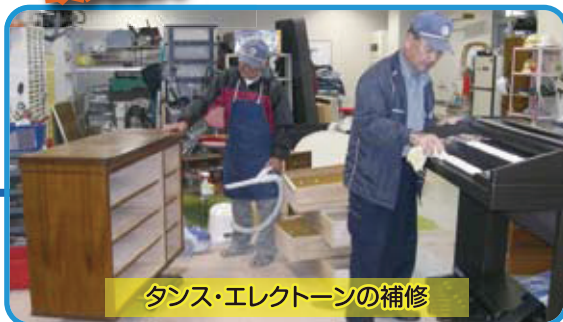
ダンス・エレクトーンの補修