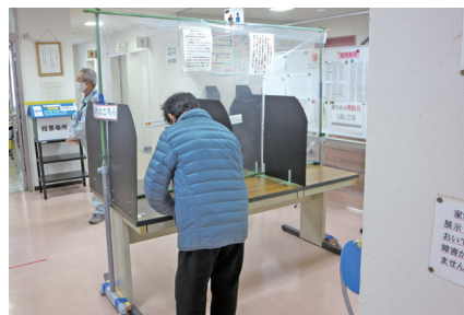
記入場所の間仕切り