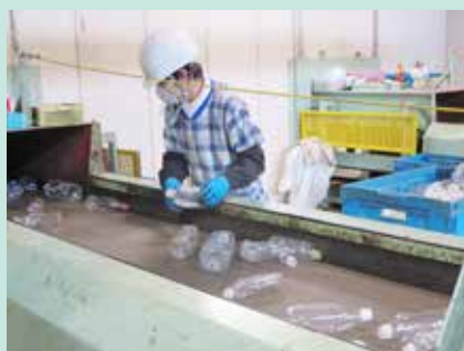
▲ペットボトルの手選別の様子