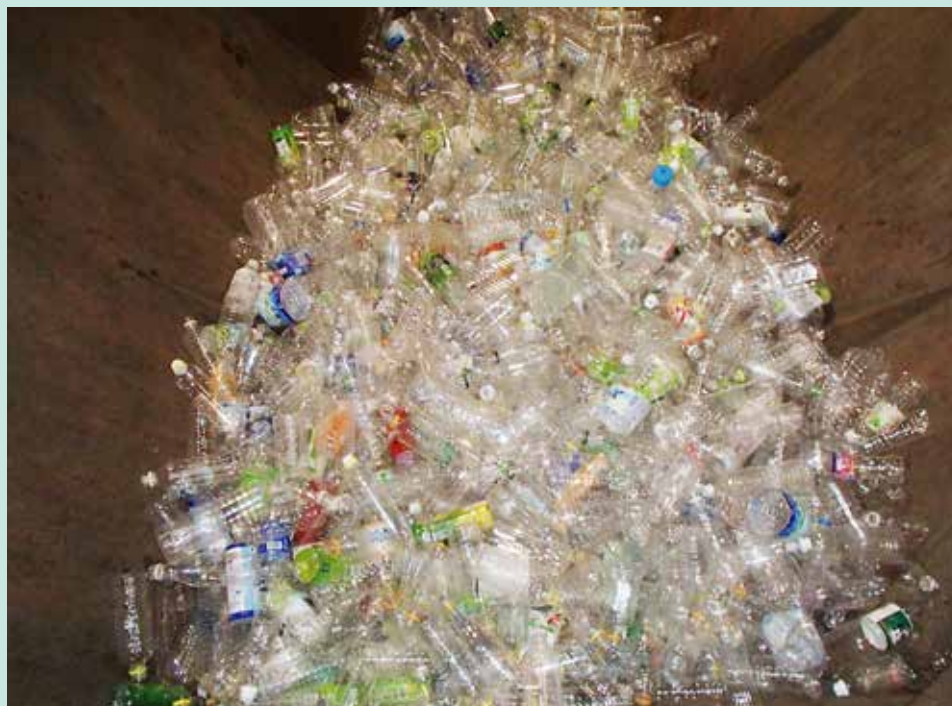
▲サンポートに搬入されたペットボトル（H 30年4月分）