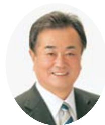
平成30年 年頭のごあいさつ